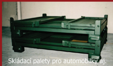
Skládací palety pro automobilky aj.

restaurace nebo prodejní stánky tvořily v letech 1992 – ca. 2000 významný podíl výroby, avšak postupně byla výroba „obyčků“ utlumována. Speciální ocelové kontejnery se začaly vyrábět již v roce 1994 a postupně přebraly vedení v našem sortimentu.