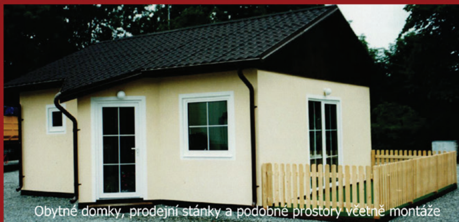
Obytné domky, prodejní stánky a podobné prostory včetně montáže