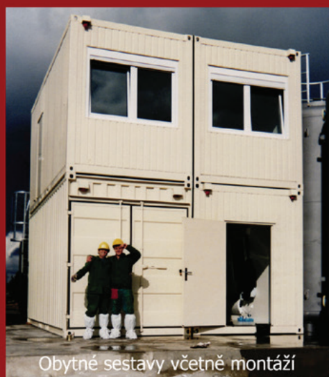
Obytné sestavy včetně montáží