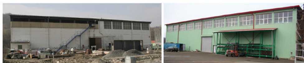
Svárna II Přestavba původního seníku na svařovnu pro nadměry

Starý sklad byl zbourán a vznikla zcela nová moderní budova