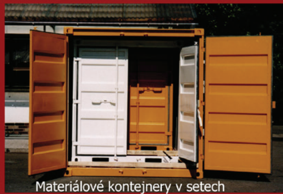
Materiálové kontejnery v setech