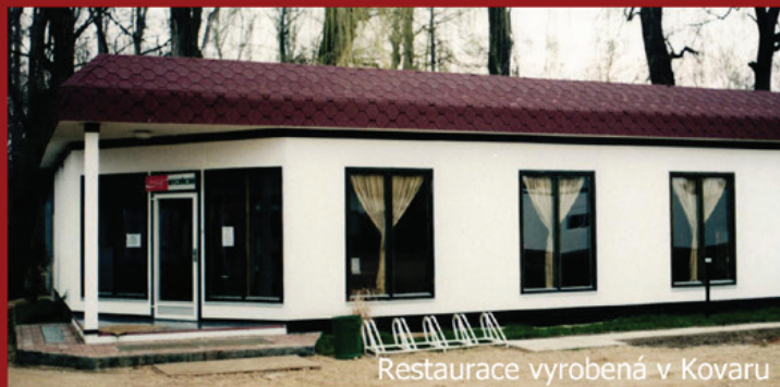
Restaurace vyrobená v Kovaru