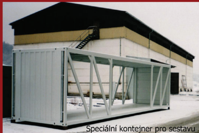
Speciální kontejner pro sestavu