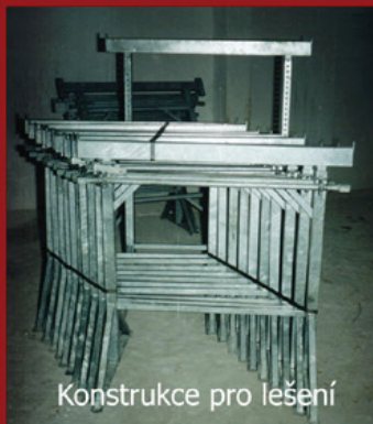
Konstrukce pro lešení