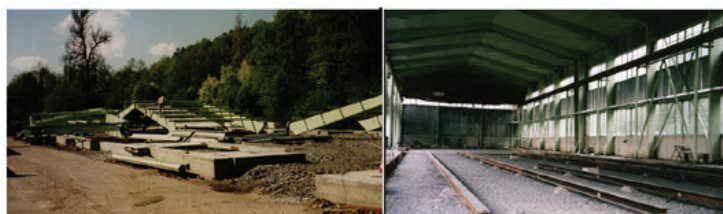
Svárna I Stavba repasované haly - první svařovna