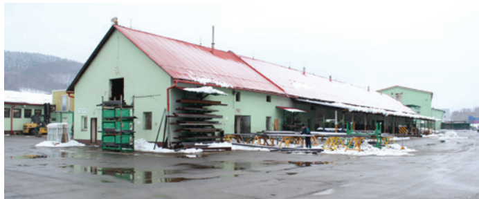
Archivní záběry staré skladové budovy zvenku a uvnitř. Byla to původně zemědělská stavba, lehce upravená k použití jako skladiště. Pamatujete na ten binec?

Víme, že skladová budova nepřináší podniku žádnou přidanou hodnotu, tak jako je tomu u výrobních prostor nebo strojů. Proto byla jeho výstavba tak dlouho odkládána. Ovšem věřím, že tato obrovská investice (pro firmu zatím největší) se postupně vrací v přehlednosti a dohledatelnosti jednotlivých materiálů a zboží. Každá skladová položka, umístěná v zakladači Kardex, má svoje stálé místo, takže každý pracovník skladu, který třeba zastupuje nepřítomného kolegu, má stejný přehled. Nový sklad nám přináší úspory v časech chystání materiálu do výroby, vyšší přehlednost v materiálových tocích a spoustu nevyčíslitelných výhod. Obrovská výhoda je už jen to, že