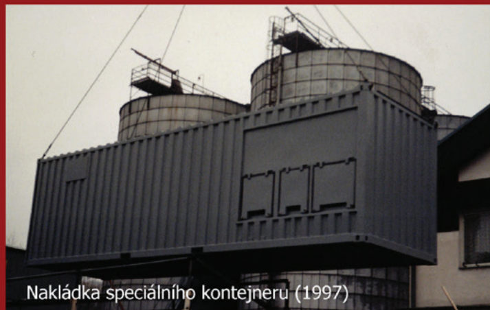
Nakládka speciálního kontejneru (1997)