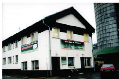
Vlastní prostory Odkup areálu JZD