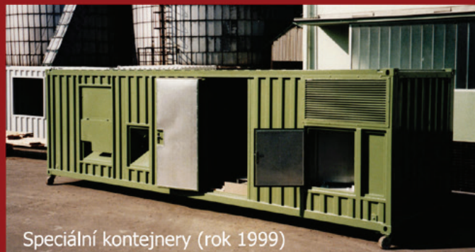
Speciální kontejnery (rok 1999)